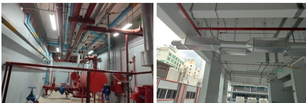
ภาพที่ 2 บริเวณดำเนินการแก้ไขท่อไอเสีย Fire Pump ที่อาคารจอดรถชั้น 8

ปัจจุบันจากการที่โครงการได้จัดทำ ท่อลดเสียงจากท่อไอเสียของ Fire Pump วัสดุที่ใช้ในการลดเสียงได้แก่ Duct Silencer ไม้เรียบร้อยแล้วดังภาพที่ 2 และเพิ่มเติมทำพื้น PU โรยทรายที่จอดรถ PU โรยทรายพื้นที่จอดรถและทางวิ่งรถบนอาคาร เมื่อจัดทำแล้วเสร็จ ทำให้รถที่วิ่ง ไม่ทำให้เกิดเสียงเอี้ยดอีกต่อไป (ภาพที่ 3)